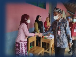
Pelayanan Keliling Perizinan Berusaha