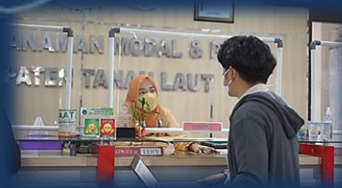
Pelayanan Perizinan Berusaha